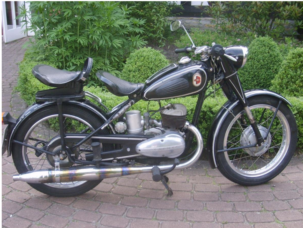
„Bastert“ B/SM 1952, 150 ccm, 6 PS Sachs-Motor